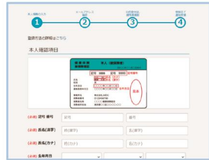
オンラインユーザー登録画面

URL https://pepup.life/users/ekyc/OPABJm0i/sign_up