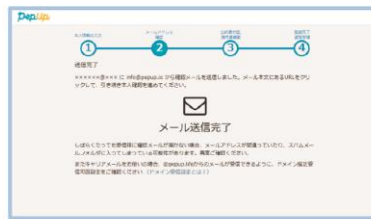
ユーザー同意画面

※ここまでパソコンで操作されていた方には画面にQRコードが表示されます。スマートフォンのカメラ機能で読み取り、以降の手続きを進めてください。